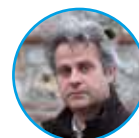
di Lorenzo Marenesi

per tutti coloro che sono dotati di sensibilità poetica o letteraria, considerati i paesaggi dolci e romantici che si alternano a quelli più selvaggi misteriosi ed impervi, e le numerose antiche ville, dimore, castelli, rocche, che racchiudono storie affascinanti.